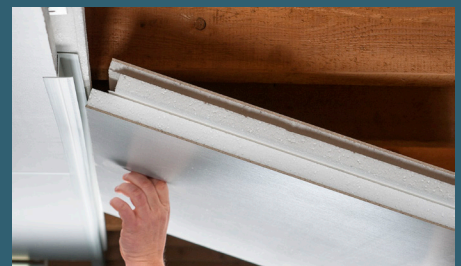
Einfache Selbstmontage möglich

Andere Formate, Isolations- oder Beschichtungsmaterialien, Isolations- oder Beschichtungsstärken, Deck-schichtfarben, Kanten- und Stossverbindungen auf Anfrage.