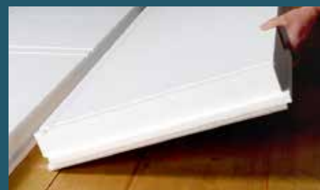
Die Isolationselemente können direkt in die Deckenschalung eingelegt werden.

Die Elemente lassen sich problemlos mit Hartmetallschneide-Werkzeugen bearbeiten.