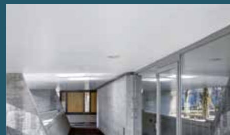
in beliebtes Bauteil im Bereich von öffentlichen Bauten.