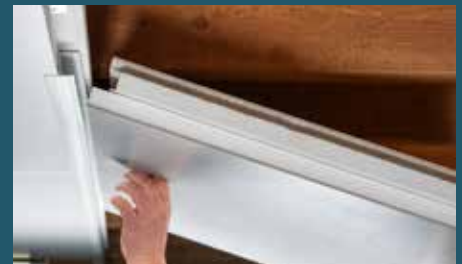
Einfache Selbstmontage möglich

Andere Formate, Isolations- oder Beschichtungsmaterialien, Isolations- oder Beschichtungsstärken, Deckenschichtfarben, Kanten- und Stossverbindungen auf Anfrage.