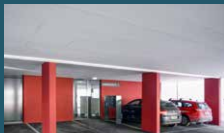
Für moderne Bauten: Optimale Erscheinung dank wählbaren Deckschichten.