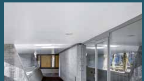
in beliebtes Bauteil im Bereich von öffentlichen Bauten.