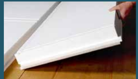
Die Isolationselemente können direkt in die Deckenschalung eingelegt werden.

Die Elemente lassen sich problemlos mit Hartmetallschneide-Werkzeugen bearbeiten.