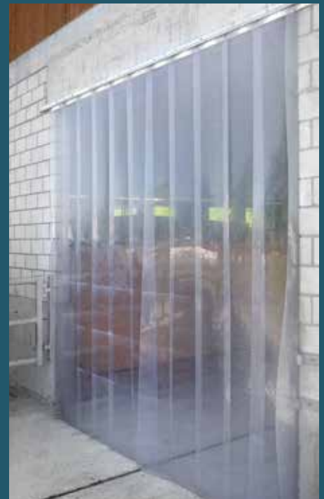
Abtrennung in Grossviehstall