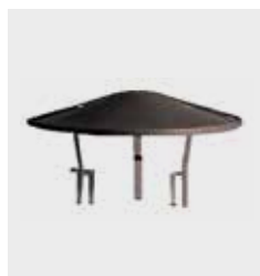
Kaminhut mit Halterung