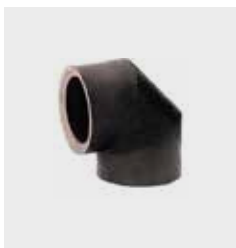
Rohrbogen 45° + 90°