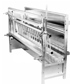
Gang- / Wandmodell