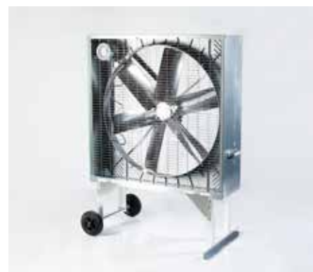
Ventilator mit Fahrgestell