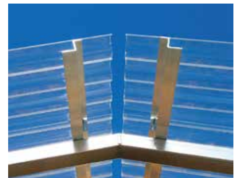
Firstabdeckung mit Abluftspalt